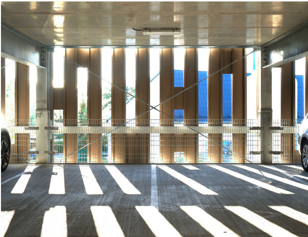
Innenansicht Fassade