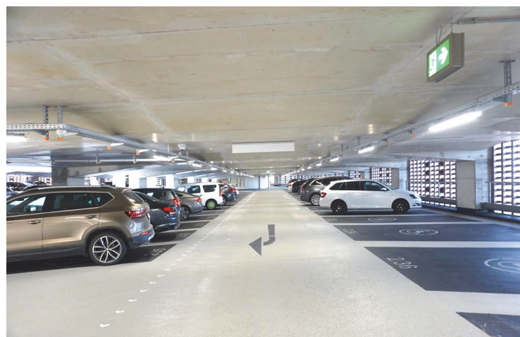
Etage de Parking