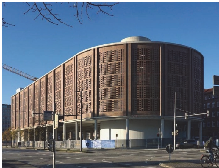
Vue côté hôtel de ville

La Façade du Parking montre de différents appareillages artistique de briques. Pour ceux-ci une procédure de consentement au cas par cas a dû être établi.