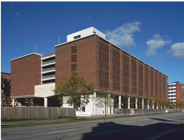
Ansicht von der Kaistraße