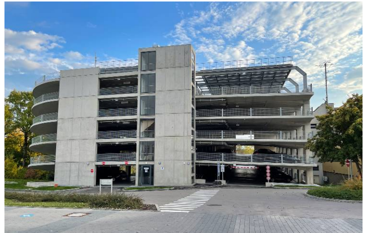
Ansicht von Norden