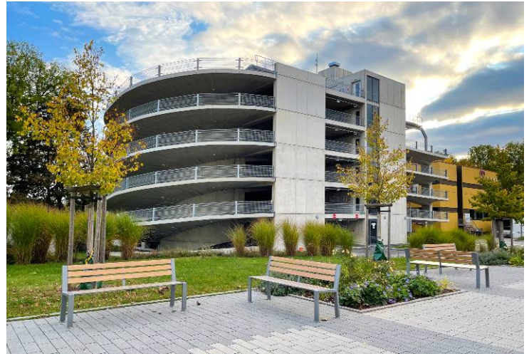
Ansicht vom Klinikum

Auf dem Dach befindet sich eine Photovoltaikanlage mit einer Leistung von 98 KW. Im Parkhaus befinden sich 8 Ladepunkte für Elektrofahrzeuge.