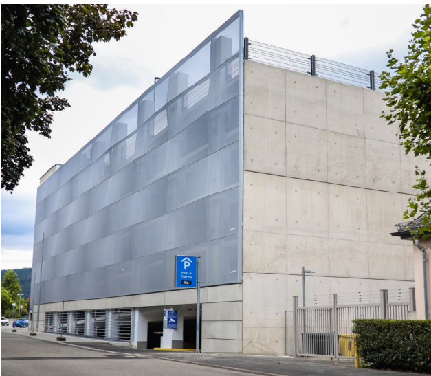
Ansicht von Südwesten