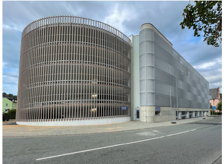
Ansicht von Südosten

Wie bei AMP-Garagen üblich, bewegt sich der Verkehr im Einbahnverkehr. Die Stellplätze sind 2,50 m breit und benutzerfreundlich schräg aufgestellt.