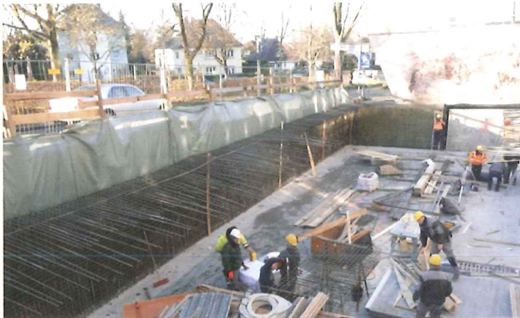
Arbeiten auf der Zwischendecke

Körnerstraße 25 · D-76135 Karlsruhe Telefon: 0721 / 985 74 - 0 · Fax: 0721 / 985 74 - 99