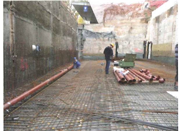
Verlegung der Grundleitung in der Bodenplatte