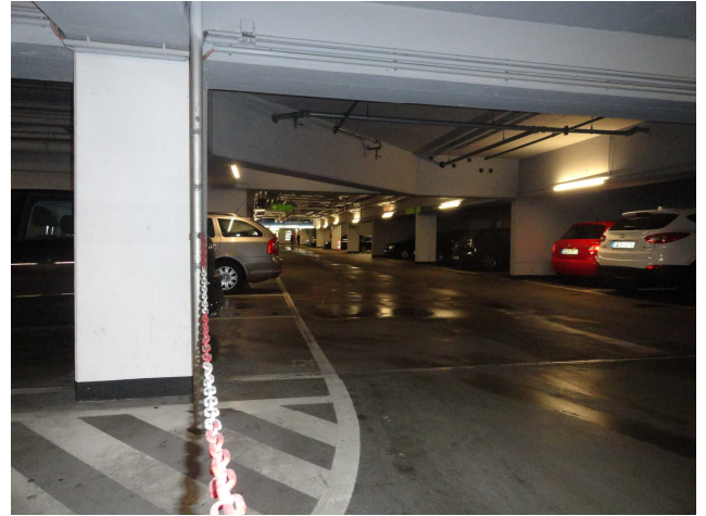
Garageneinfahrt vor der Instandsetzung